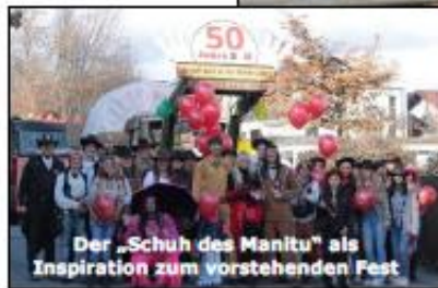
Der „Schuh des Manitu“ als Inspiration zum vorstehenden Fest