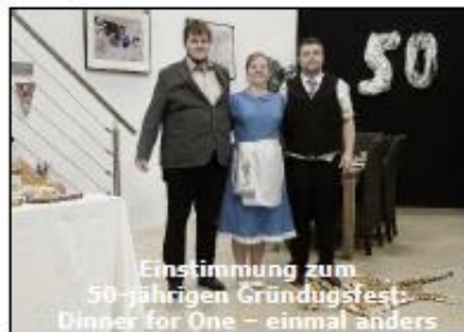
Einstimmung zum 50-jährigen Gründungsfest: Dinner for One – einmal anders