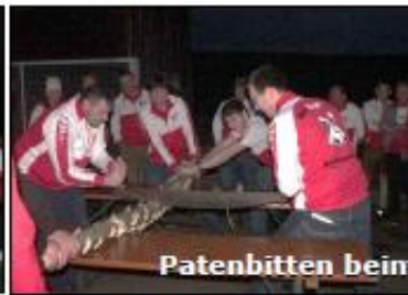
Patenbitten beim SKK Eschlkam