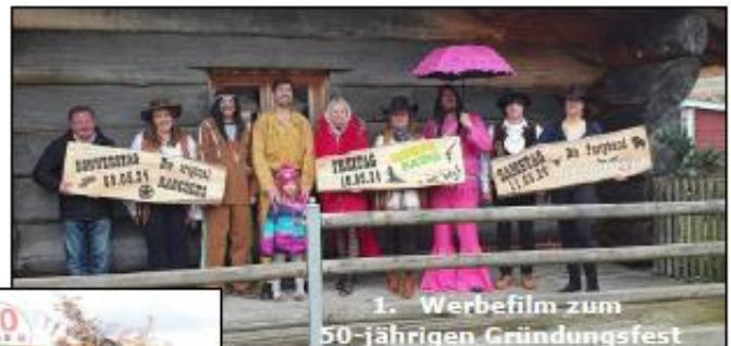
1. Werbefilm zum 50-jährigen Gründungsfest