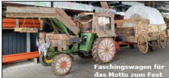
Faschingswagen für das Motto zum Fest